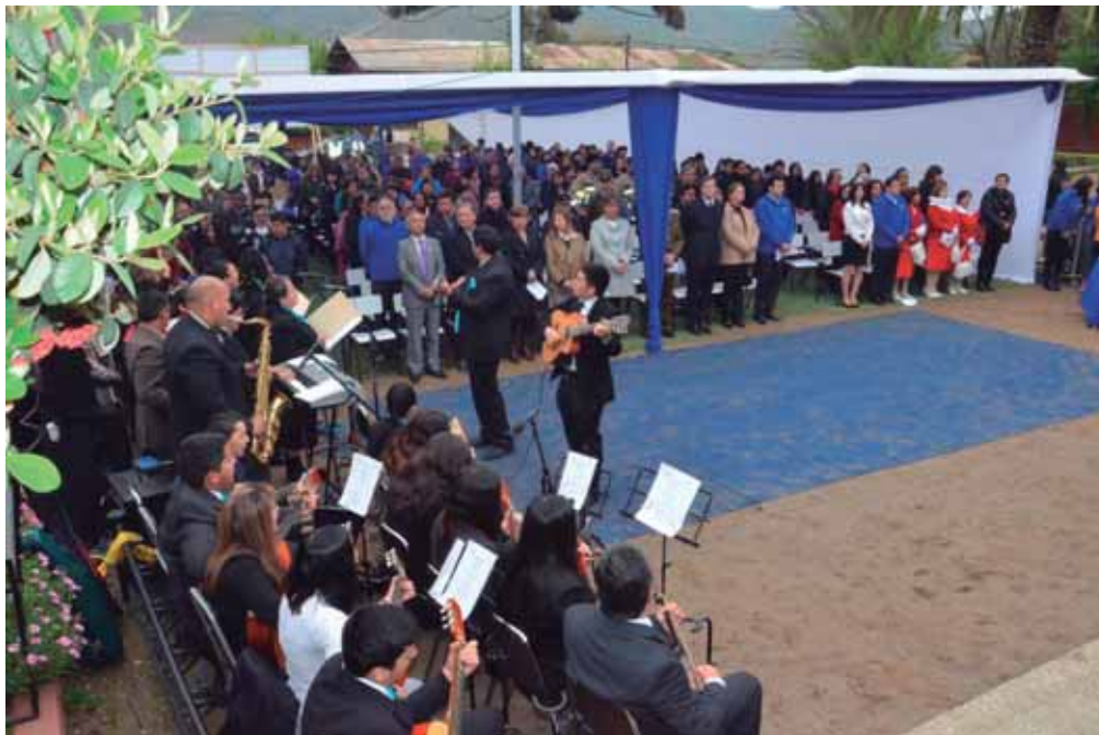
Ceremonia de Aniversario Comunal