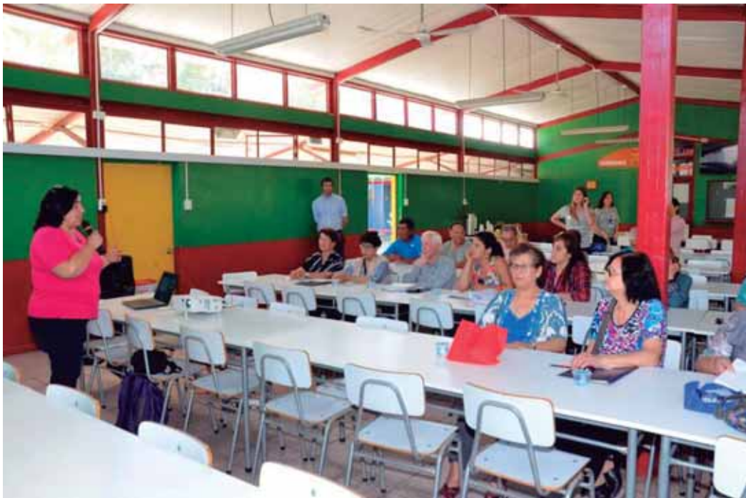
Finalización Proyecto Fosis Junta de Vecinos Colo Colo