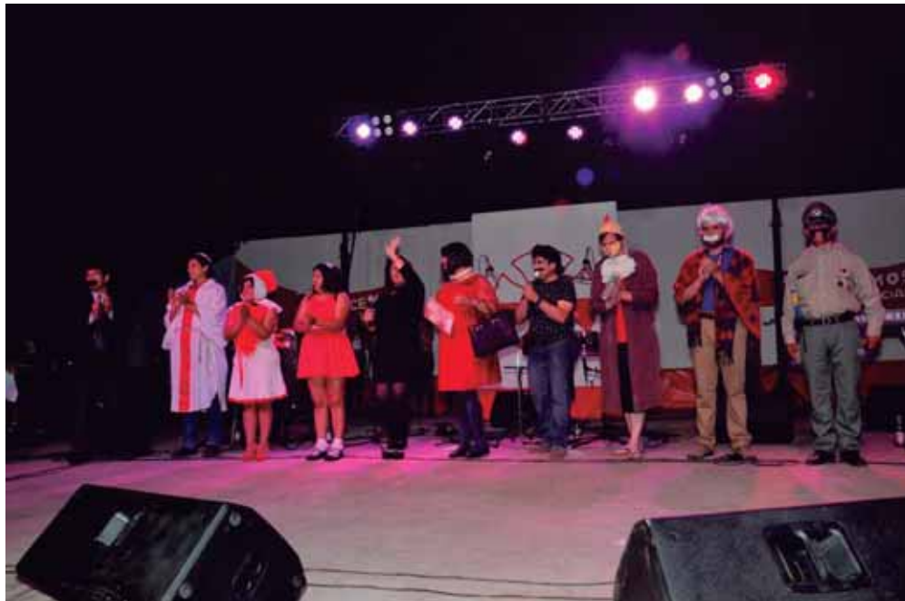
Certificación Curso Lengua de Señas