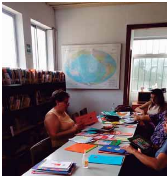
Exposición Taller “Manualidades entre libros”