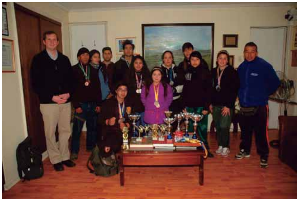
Campeonato de Judo con Escuela Municipal