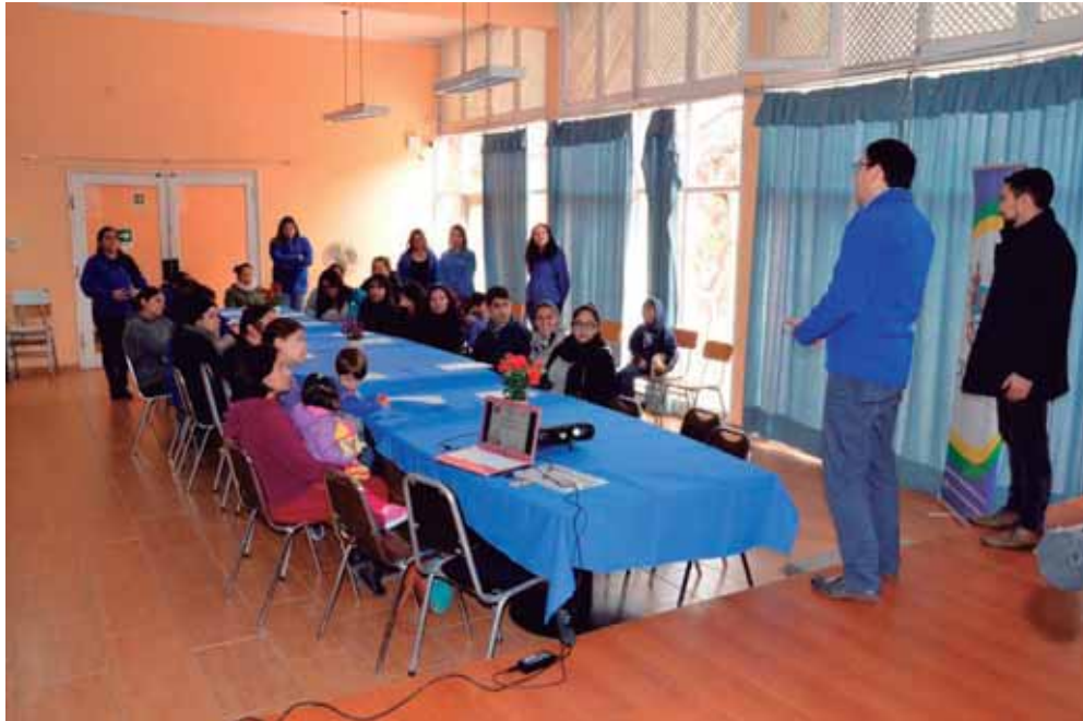
Ceremonia de Egreso de las Familias participantes del Programa Familias SSyOO, Periodo 2015-2016, realizada en diciembre, 2017.