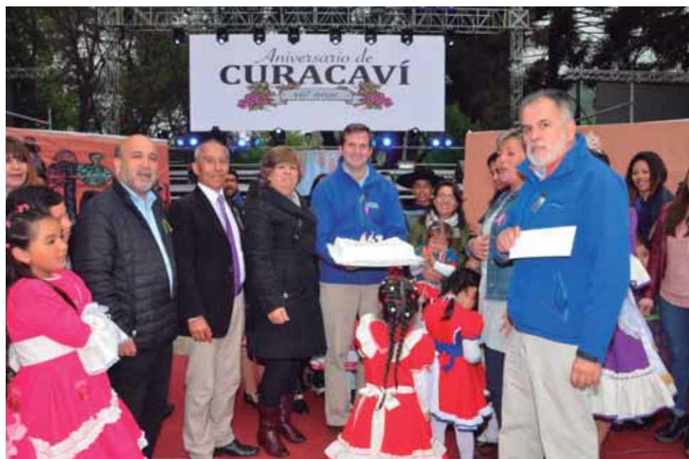
Pasacalles de Adultos Mayores