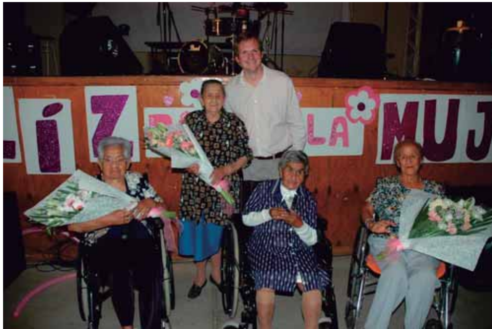
Actividad Masiva del Día de la Madre