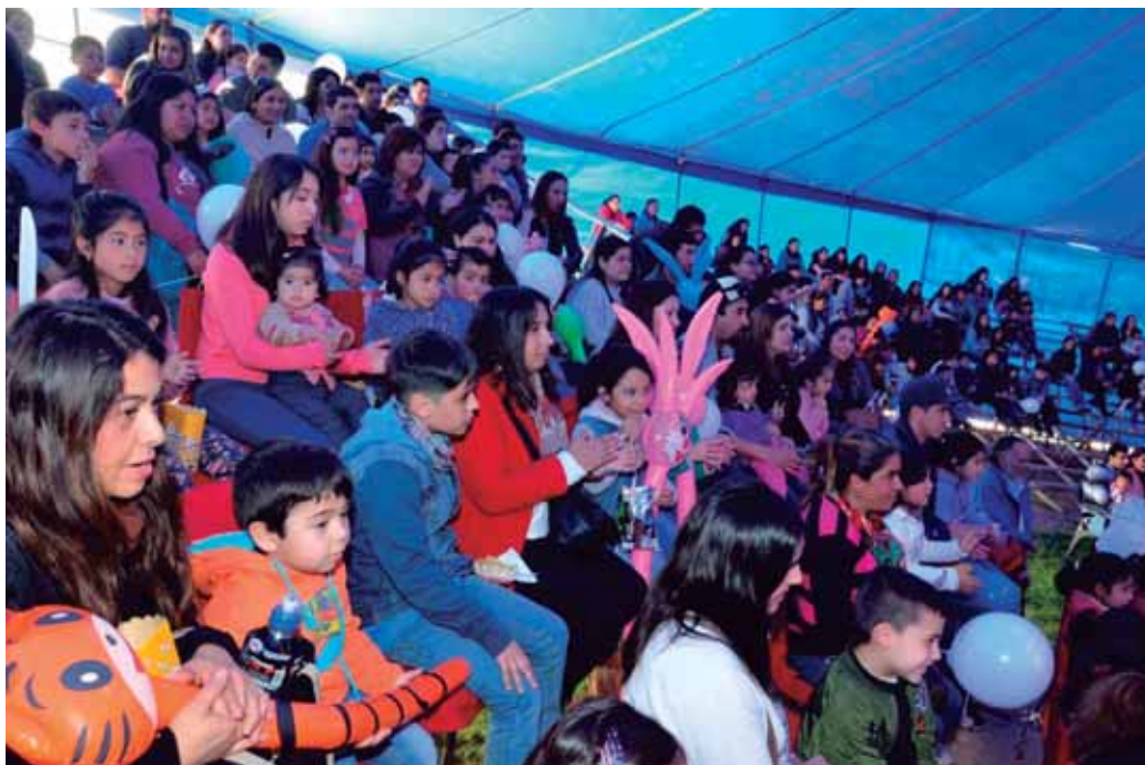
Entrega de Juguetes de Navidad a los niños y niñas de las Juntas de Vecinos