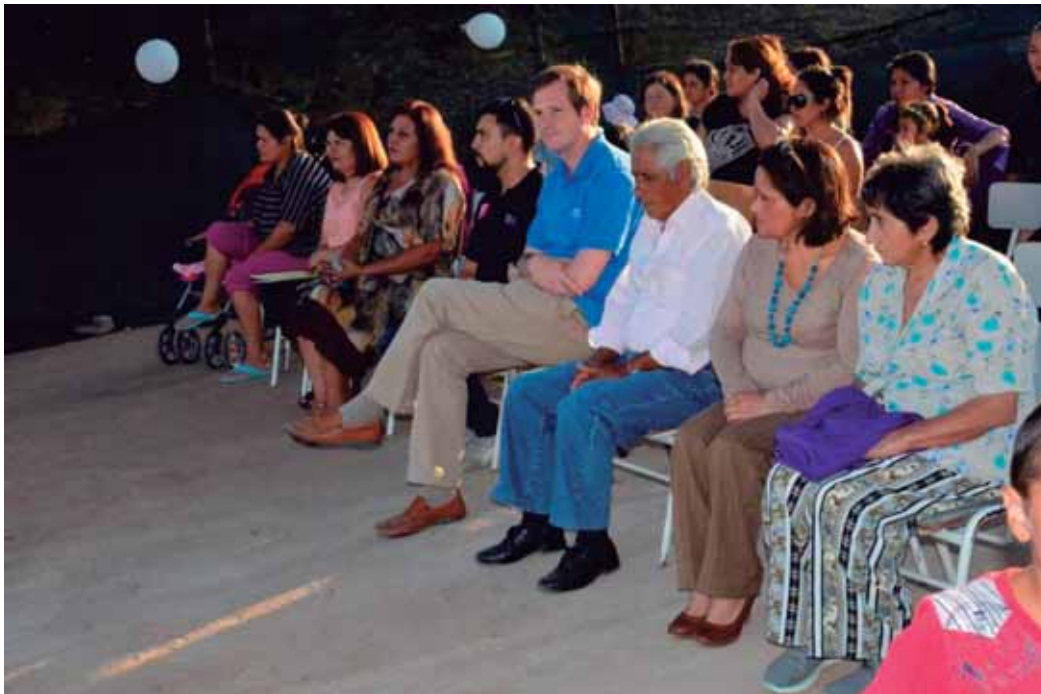
Día del Dirigente