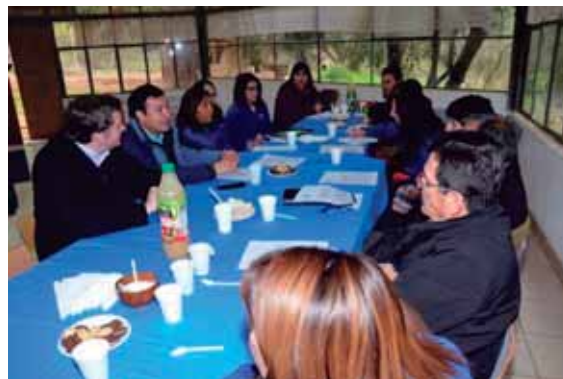
Reunión de coordinación con Comité de Agua Potable Rural de la comuna