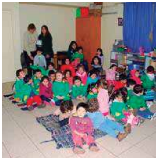
Premiación concurso “Carta a mi Madre”