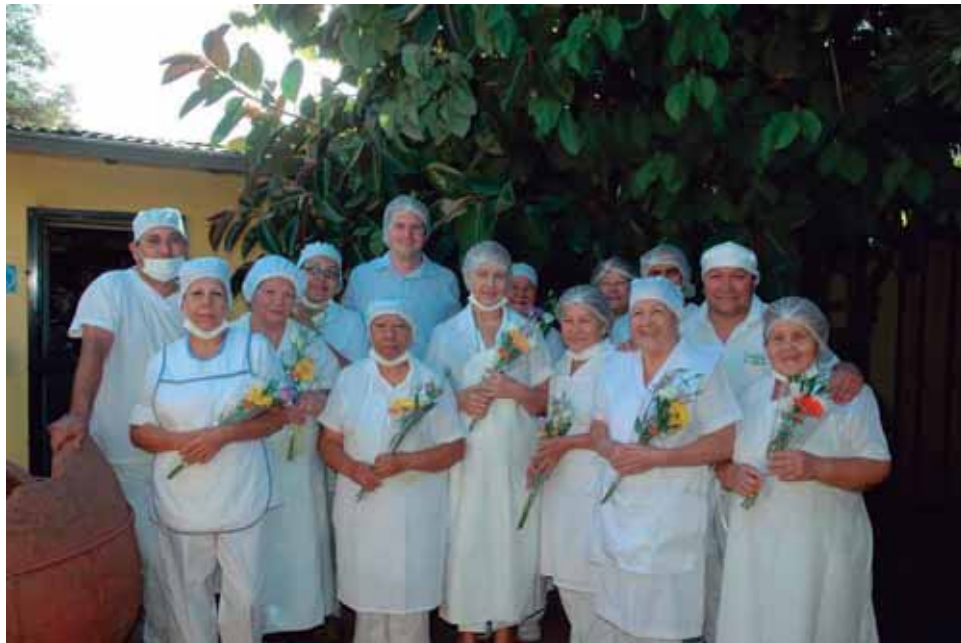
Actividad Masiva de Conmemoración del Día Internacional de la Mujer