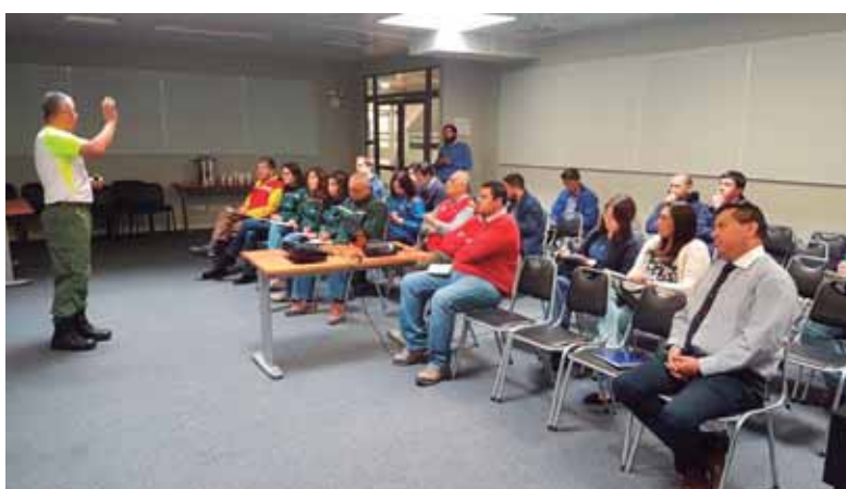
COMITÉ DE EMERGENCIAS EN TERRENO, PUESTO CERO, EVENTO MASIVO PEREGRINACIÓN AL SANTUARIO DE LO VASQUEZ, DICIEMBRE 2017