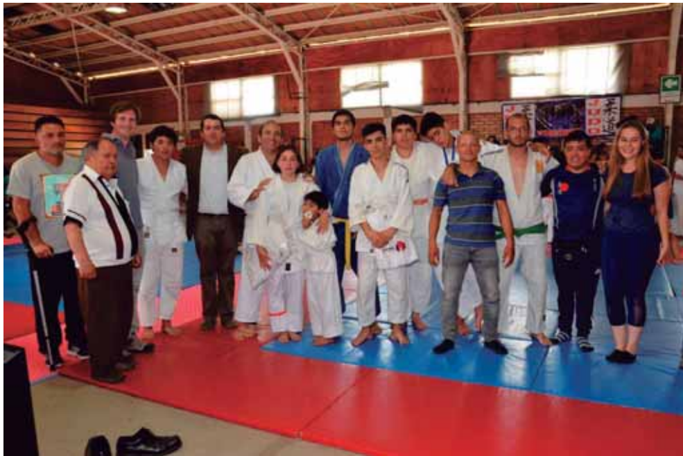
Campeonato de Fútbol Escuelas Municipales