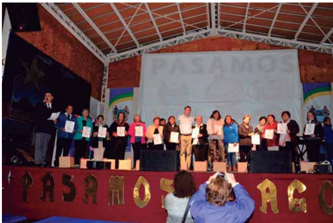
Postulaciones a Fondos Concursables