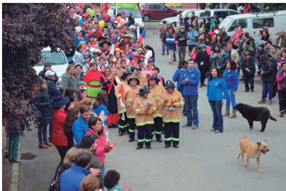
Evento Principal de Aniversario