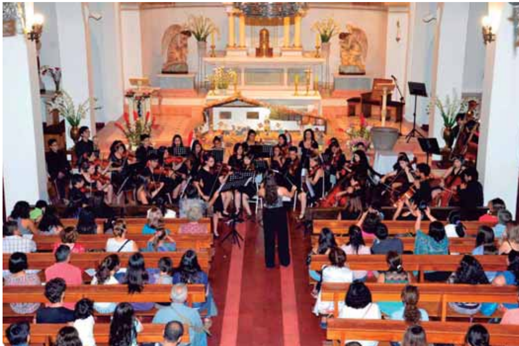
Primer Encuentro de Orquestas Juveniles, con participación de las Orquestas de la comuna de La Reina y María Pinto.