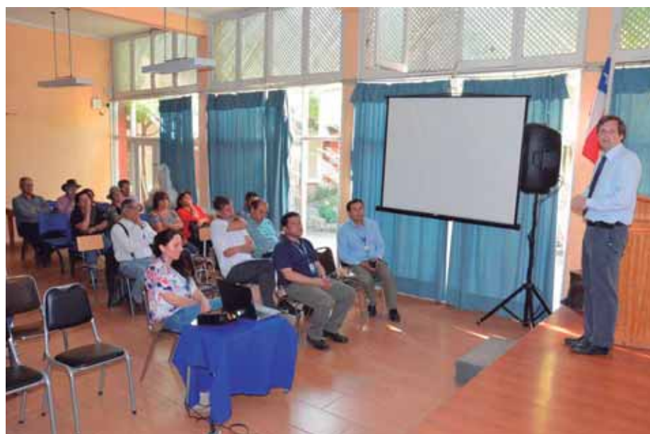
CHARLA SISTEMA COMANDO INCIDENTE, NOVIEMBRE 2017