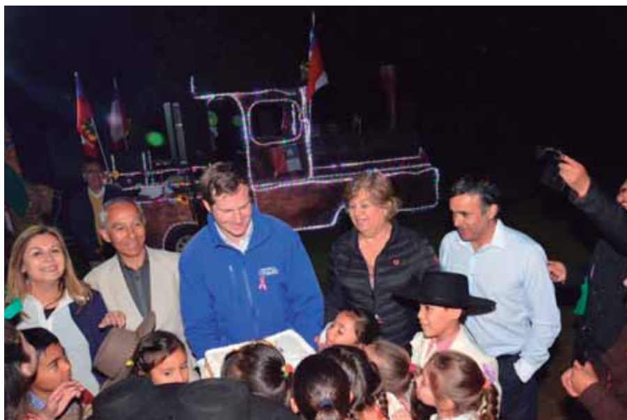
Te Deum Ecuménico