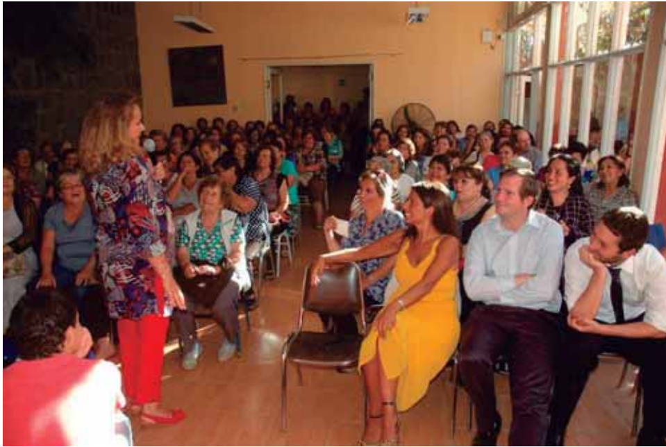
Visitas a empresas de la comuna con trabajadoras femininas en el marco del Día Internacional de la Mujer