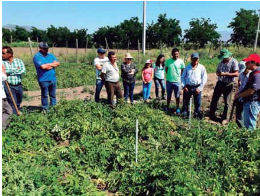
Ejecución de proyecto de inversión, adquisición de pulverizadora, localidad de Alhué