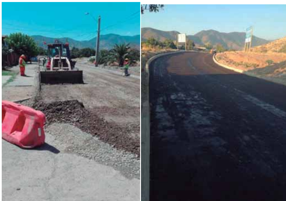
Condominio Aires de Curacaví