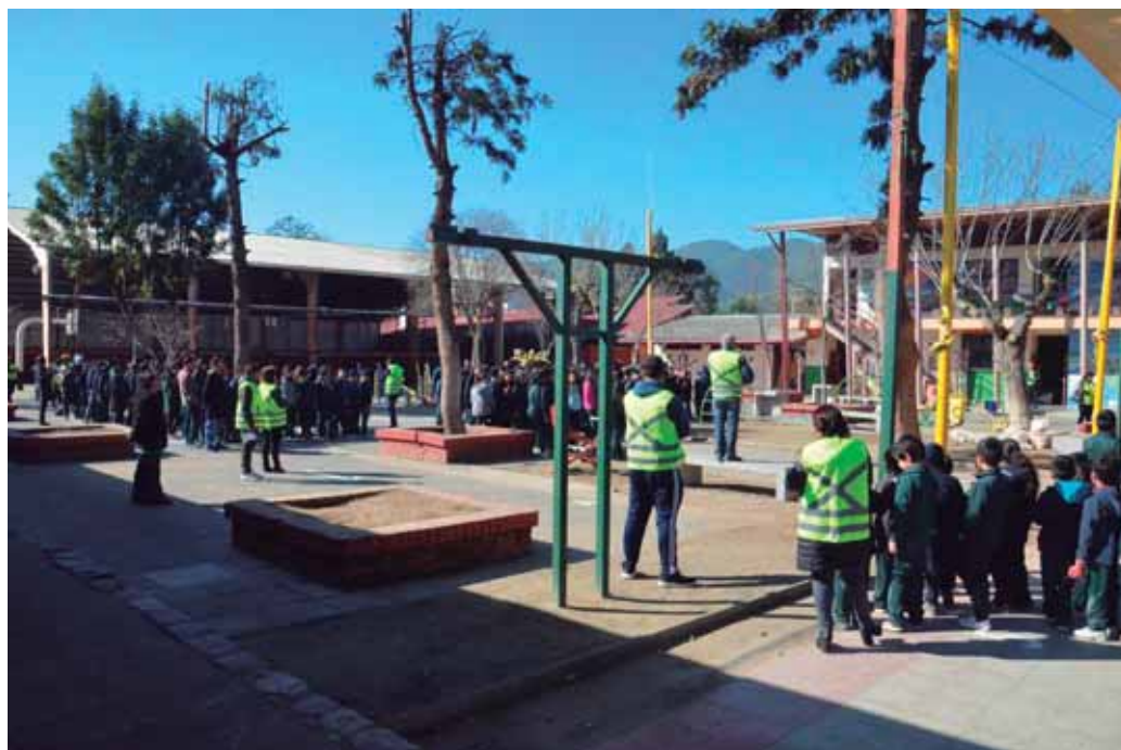
REUNIÓN DE TRABAJO CON ORGANIZACIONES Y SOCIEDAD CIVIL EN GESTIÓN DEL RIESGO EN EMERGENCIAS Y DESASTRES EN LA COMUNA, NOVIEMBRE 2017