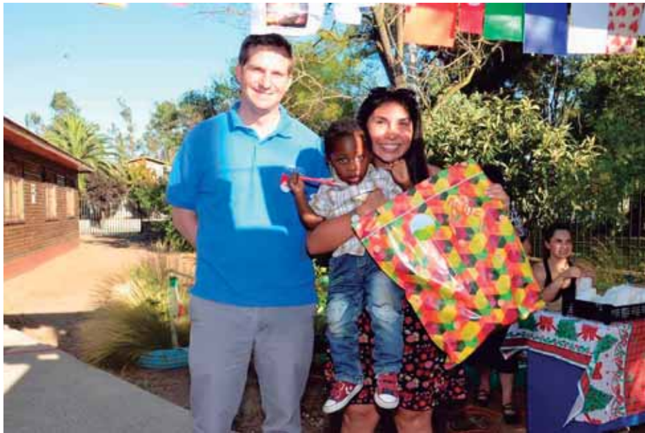
Jurado del VI Concurso de Tarjetas de Navidad