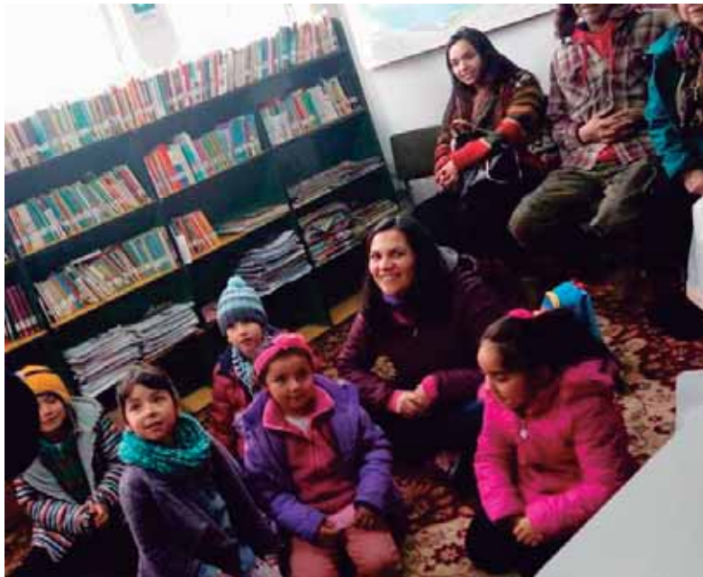
En Jardín Infantil