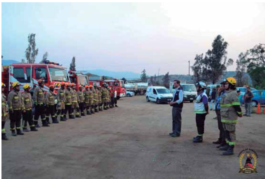
SIMULACRO DE TERREMOTO EN ESTABLECIMIENTOS EDUCACIONALES DE LA REGIÓN, AGOSTO 2017