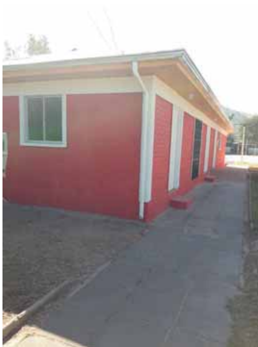
Mejoramiento pasaje Villorrio San Joaquín