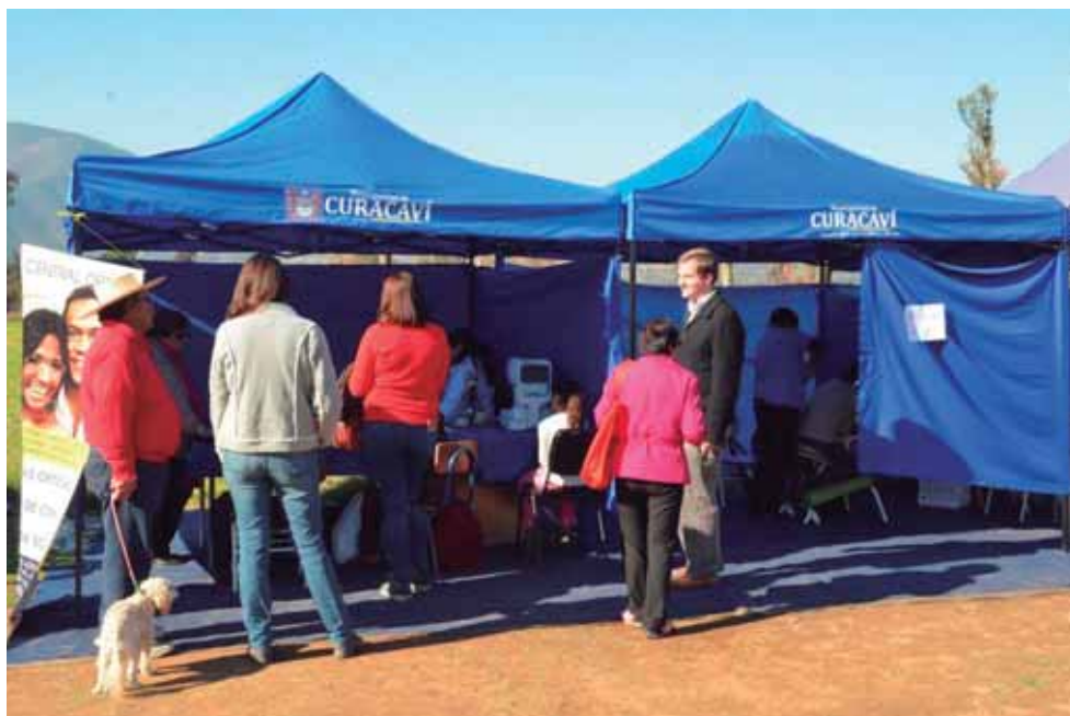
ANIVERSARIO N°467 DE LA COMUNA Fiestas de Aniversario con las Juntas de Vecinos Rurales de la comuna