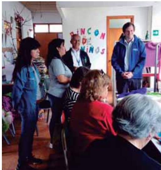
Exposición Taller Manualidades “Julieta”