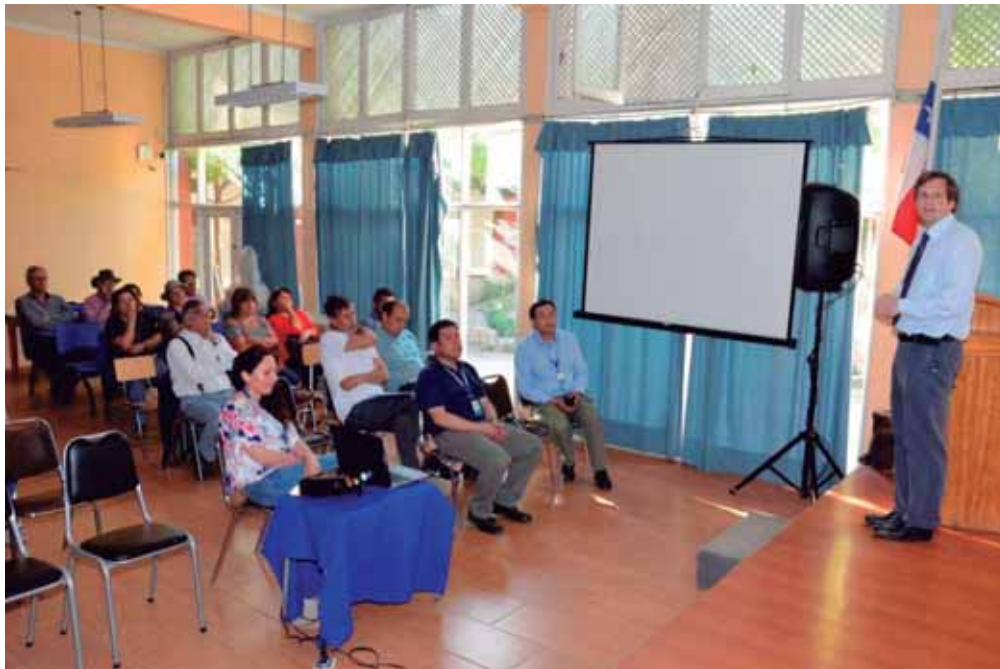
Taller de Fondos Concursables a Organizaciones Comunitarias - Sector Cerrillos Cuesta Vieja