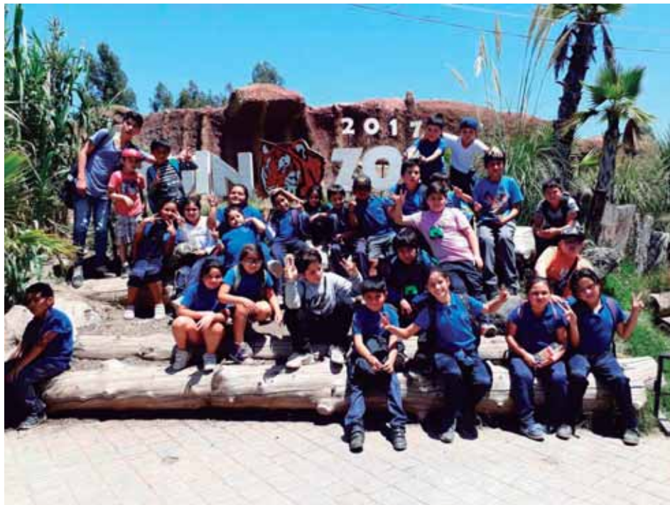
Viaje a balneario El Quisco