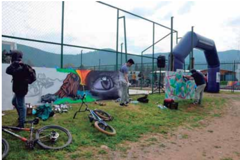
Primer torneo de BMX en Curacaví, en Parque Deportivo Urbano.