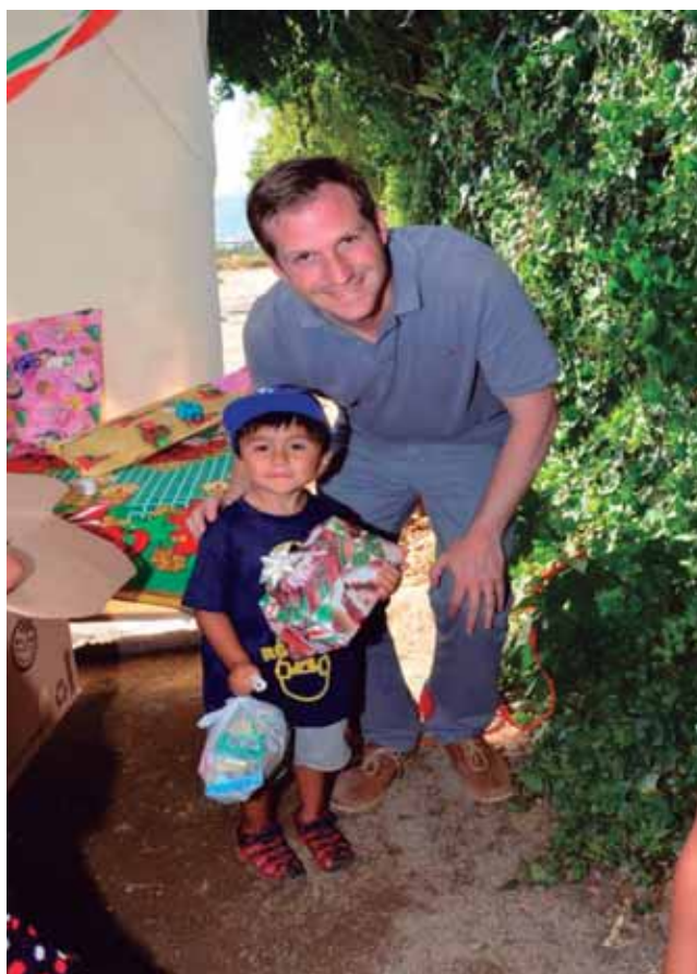
PROGRAMA DENTAL "CURACAVÍ SONRÍE"