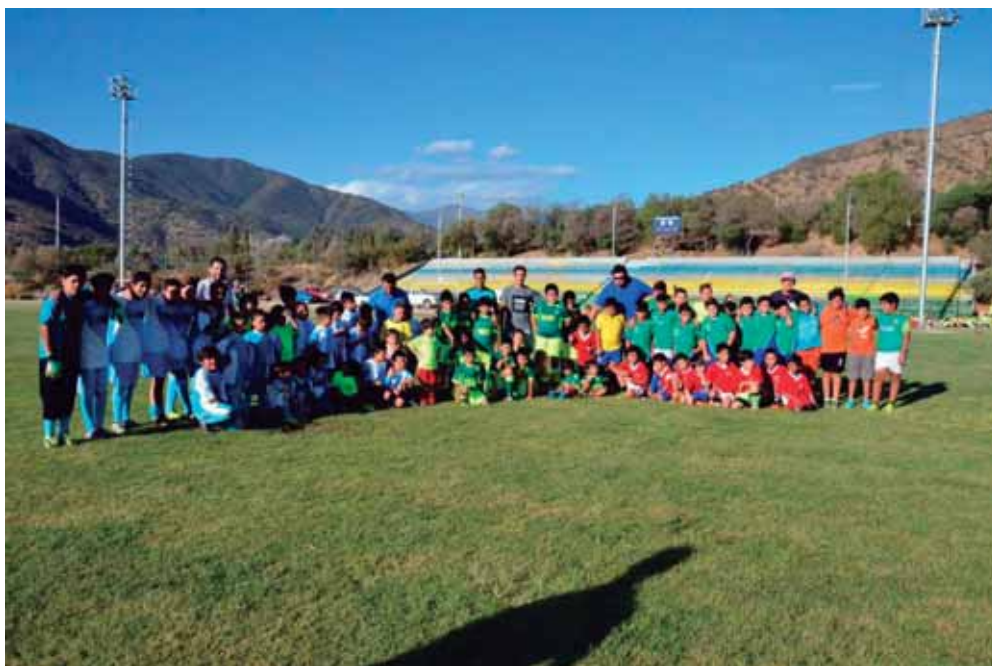
Festival de Fútbol Infantil