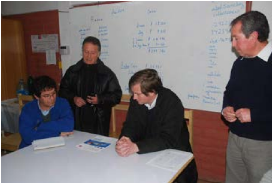
Reunión junta de vecino los aromos