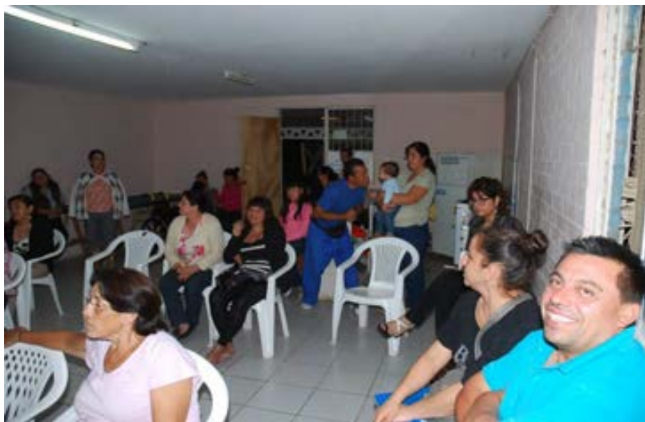
Reunión junta de vecinos cacique Calolanque