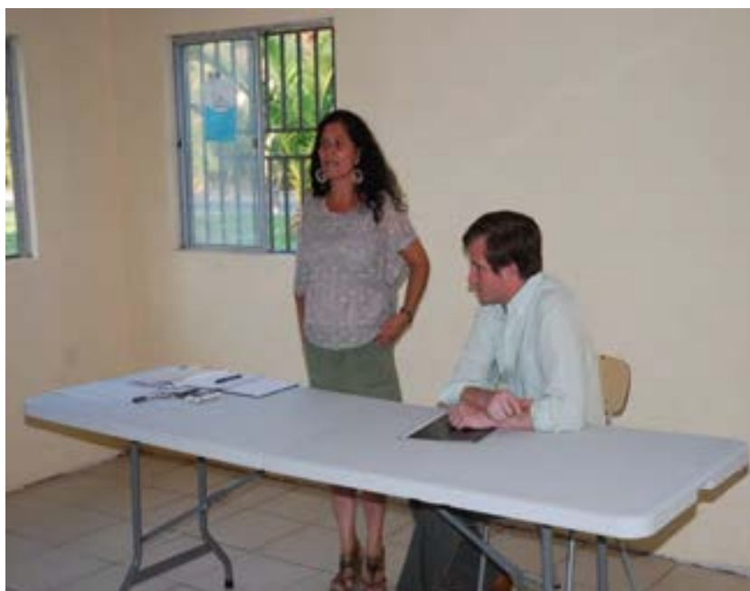
Reunión junta de vecinos cardenal Raúl Silva Henríquez