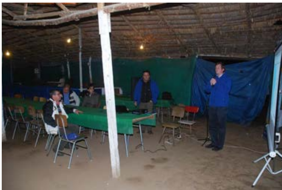
Reunión junta de vecino Villa el Sol