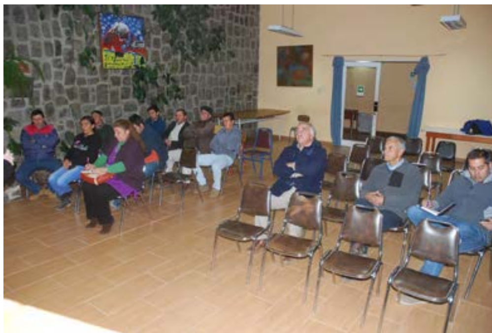
Reunión con Junta de Vecinos Patagüilla Grande