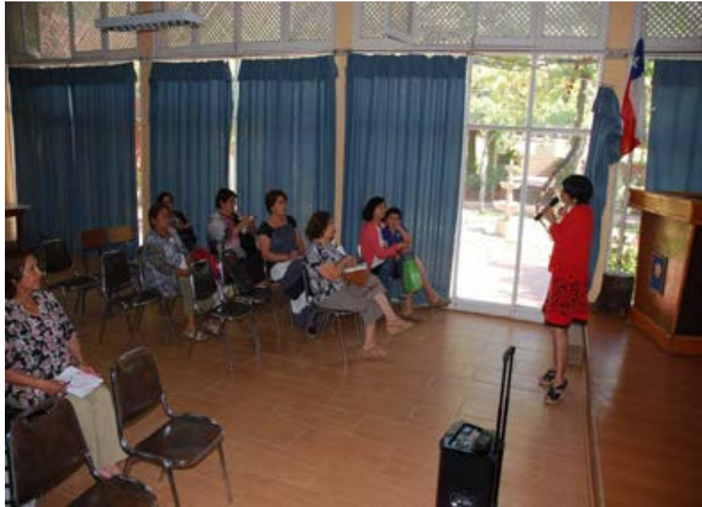
Reunión con Club de Huasos