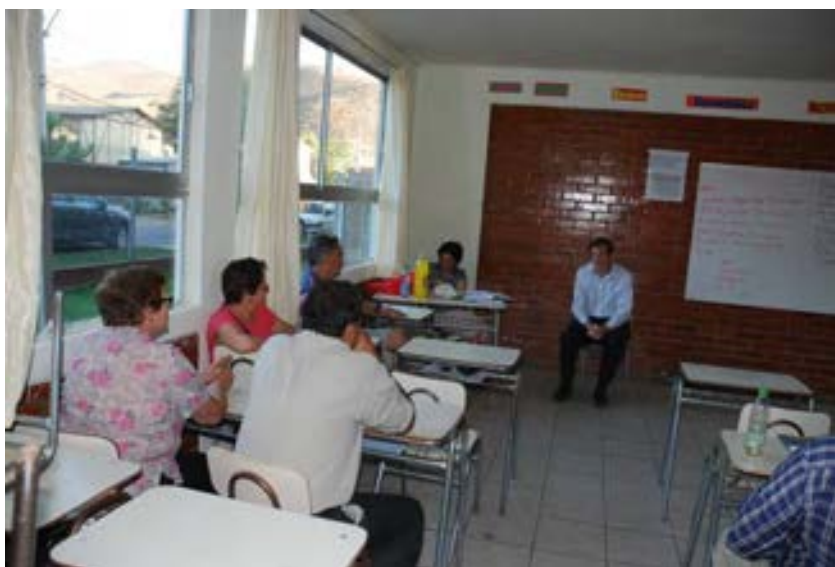
Reunión junta de vecino Villa Puangue