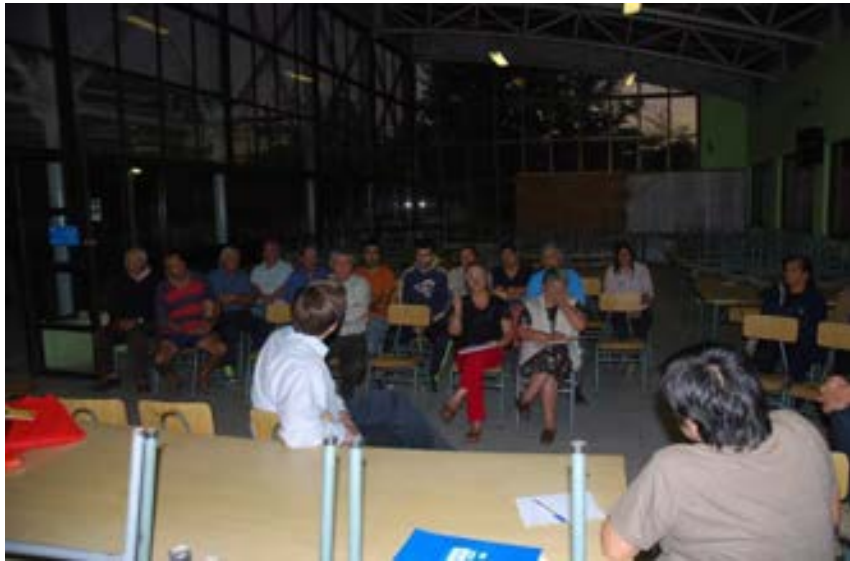
Reunión junta de vecinos villa San Francisco