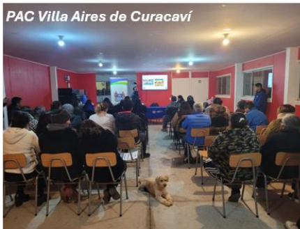
PAC Villa Aires de Curacaví