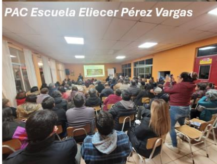
PAC Escuela Eliecer Pérez Vargas