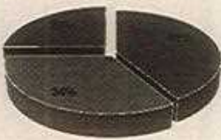
INCIDENCIA PRESPUESTO 2025